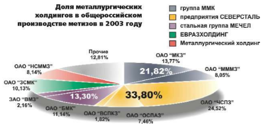
Доля металлургических холдингов в общероссийском производстве метизов в 2003 году

Группа метизных предприятий «ММК» (ОАО «МКЗ», ОАО «МММЗ») также справилась с задачей роста объемов,